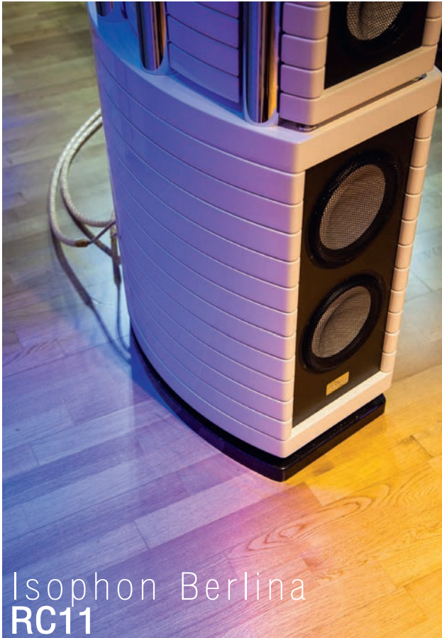
Isophon Berlina RC11

ฟังแล้วรู้สึกได้ว่าน่าปลื้มใจแม้ราคาจะสูง แต่ไม่อาจจะตัดใจขาดจากมันได้จริงๆ เหมือนทั้งความฝันและจินตนาการของตนเองลงไปเลยทีเดียว ความรู้สึกแบบนี้ไม่ได้เกิดขึ้นง่ายๆ สำหรับคนฟังเครื่องเสียงที่มีประสบการณ์ยาวนานเช่นคุณธรรมนุษย์